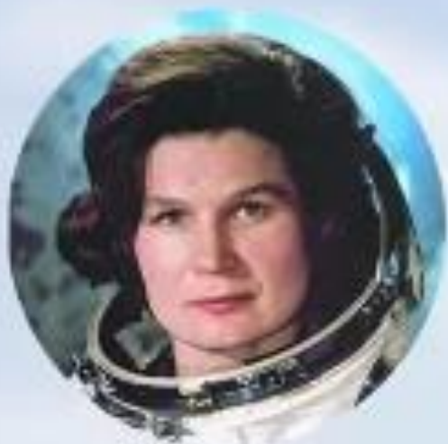
Валентина Терешкова первая женщина-космонавт позывной «Чайка»

« Эй! Небо! Сними шляпу! Я к тебе иду! »