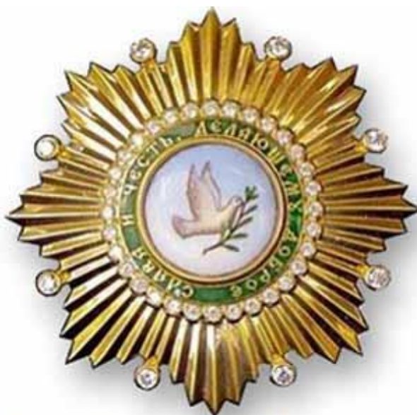
Орден Славы и Чести I степени Российской православной церкви

14. Валентина Терешкова награждена орденом, который вручается реже, чем все иные награды Русской православной церкви. Это орден I степени «Славы и чести».