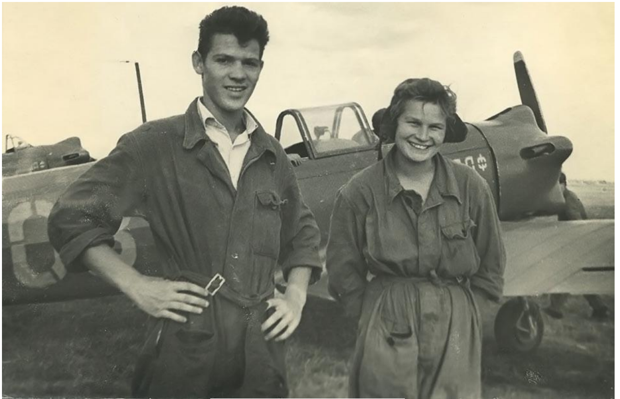
Терешкова на аэродроме

Это определило её судьбу. У С. Королёва появилась идея запустить в космос женщину-космонавта. В начале 1962 года начался поиск претенденток среди парашютисток. В результате жёсткого отбора определились пять «финалисток». Валентину Владимировну выбрали главным кандидатом на полёт в космос, поскольку она была родом из простой рабочей семьи, и была политически подкована, вела общественную деятельность, прославляя Коммунистическую партию.