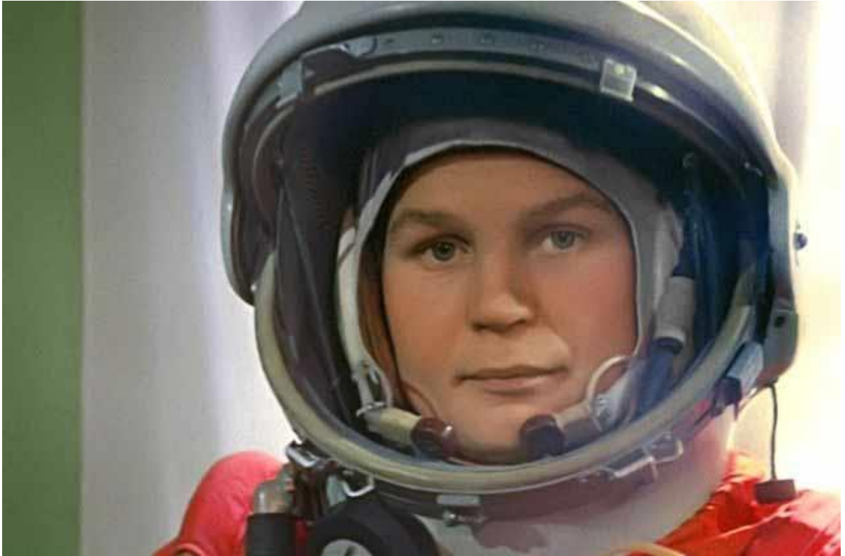
Валентина Терешкова перед стартом, 1963 г