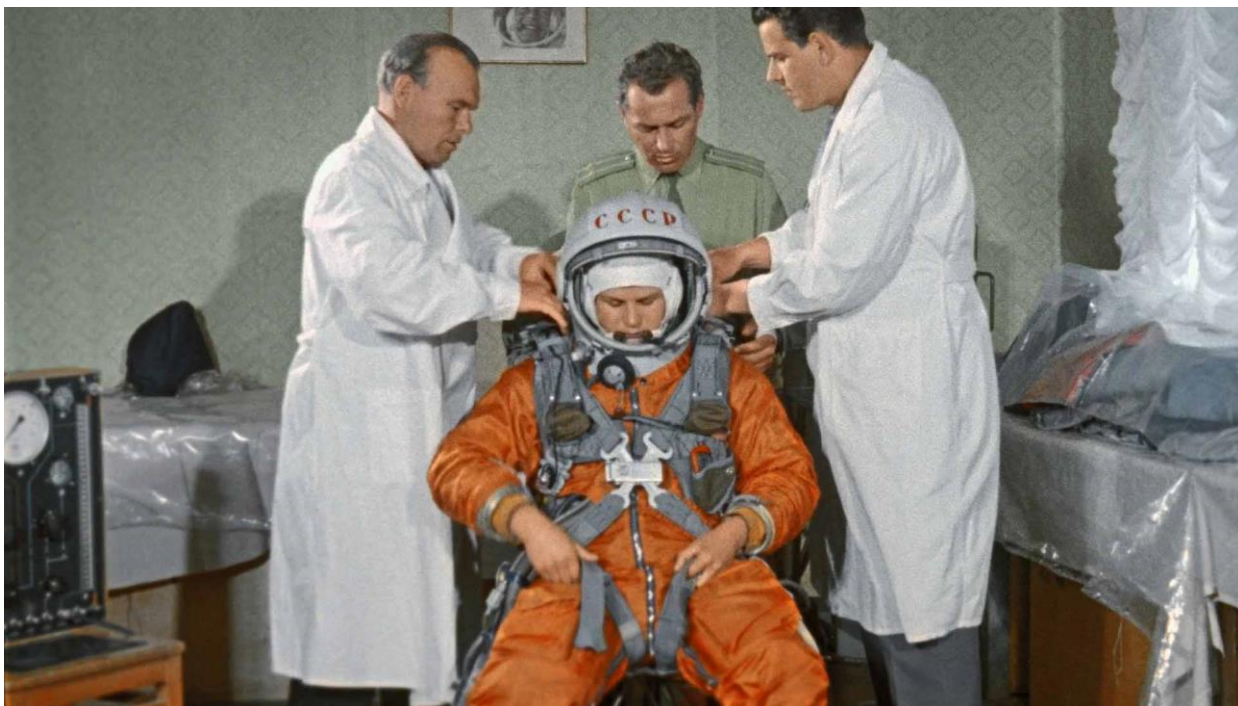
Скафандр СК-2. Космонавт Терешкова

В начале пути освоения космоса космические скафандры делались индивидуально для каждого космонавта.