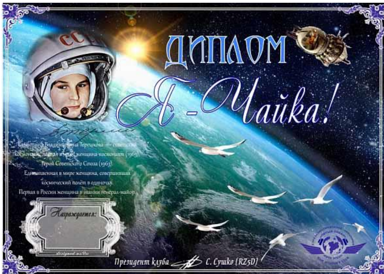
Радиолобительский диплом «Я – Чайка»

Диплом выдаётся за радиосвязи, в частности с радиостанцией Ярославской области, использующей специальный позывной, посвящённый полёту в космос В.В. Терешковой. Эскиз дизайна диплома согласован лично с Терешковой [4].