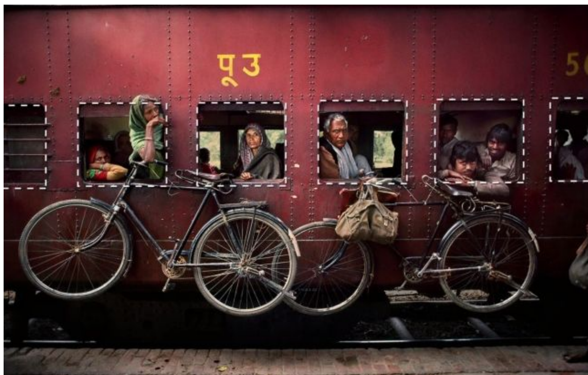
Рисунок 9. Естественные рамки