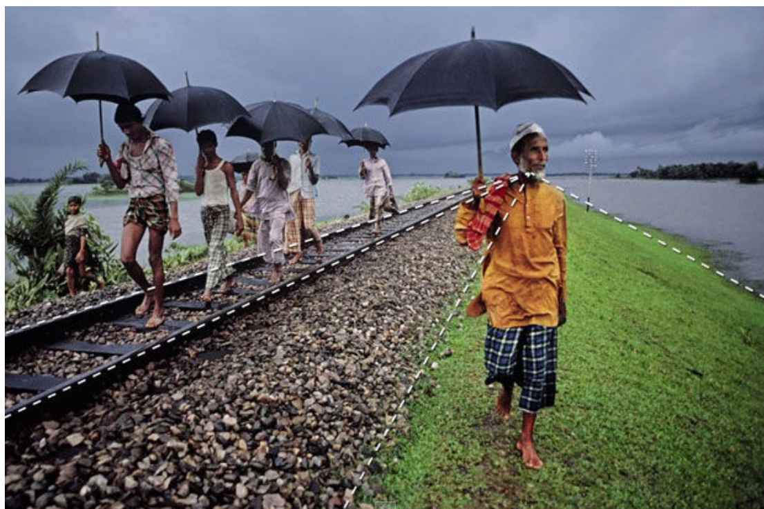
Рисунок 7. Линии