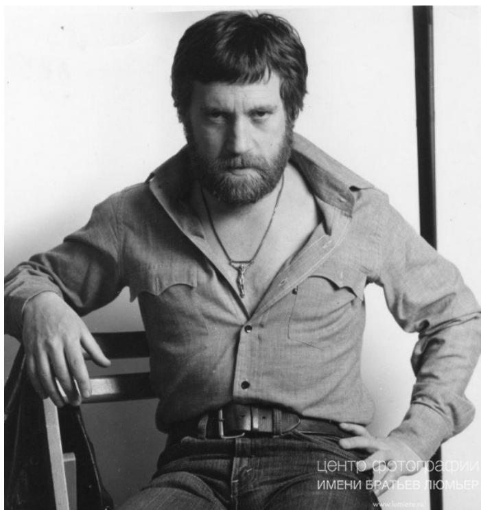
Рисунок 18. Владимир Высоцкий