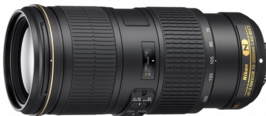
Рисунок 5. Телеобъектив (70-200 мм)