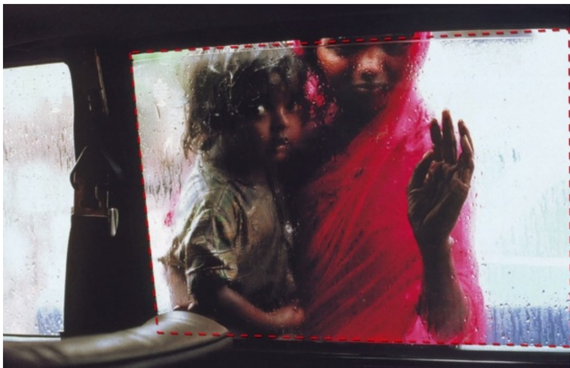
Рисунок 8. Естественные рамки