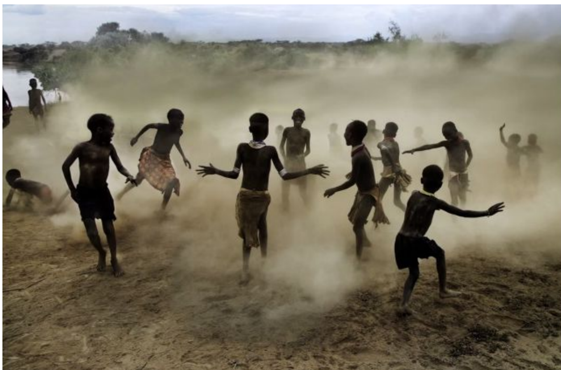
Рисунок 10. Соотношение фигуры и фона