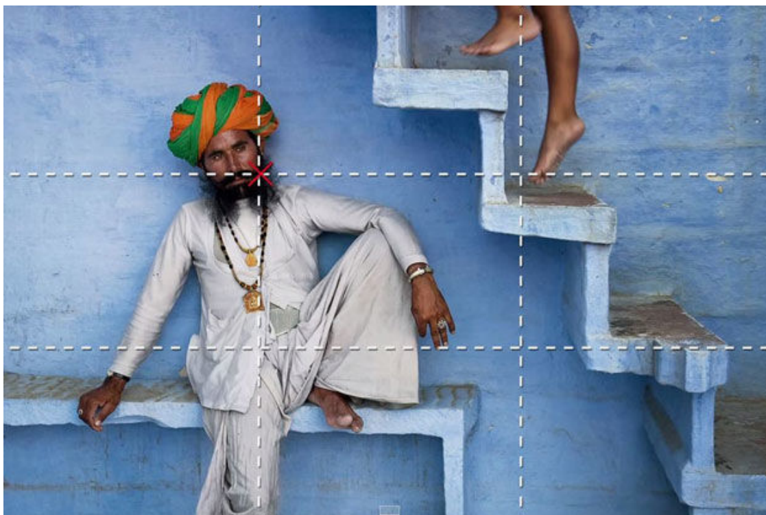
Рисунок 6. Правило третей