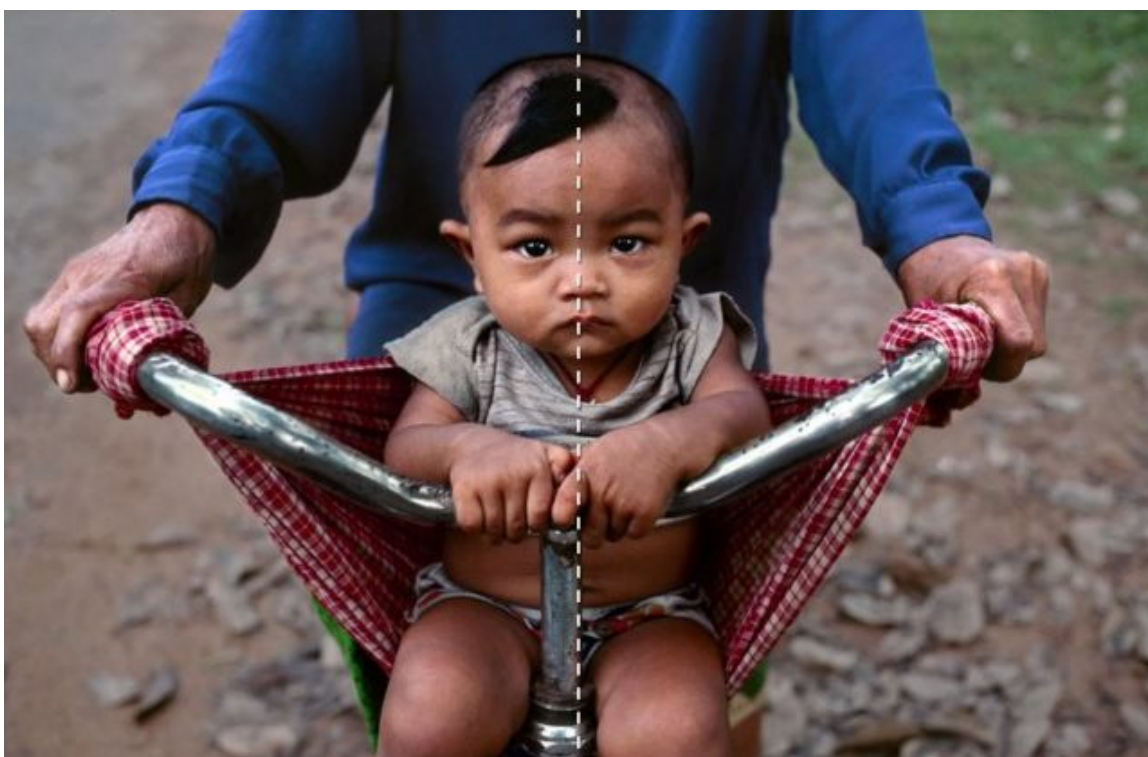
Рисунок 11. Симметрия