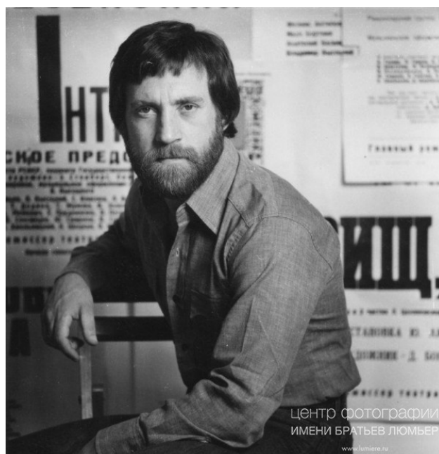
Рисунок 17. Владимир Высоцкий