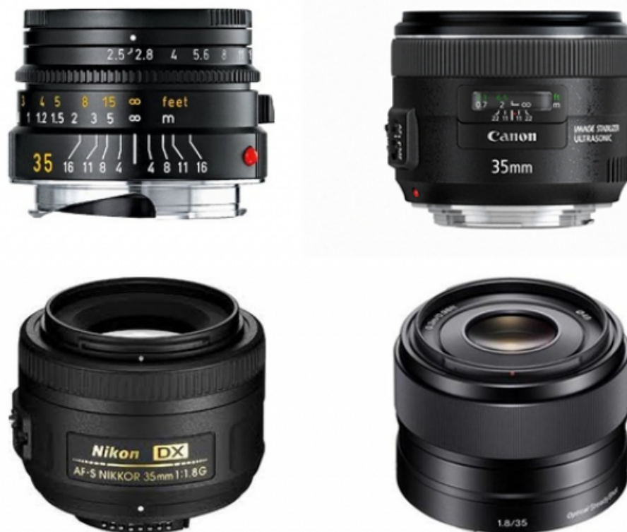
Рисунок 4. Широкоугольные объективы (35 мм)